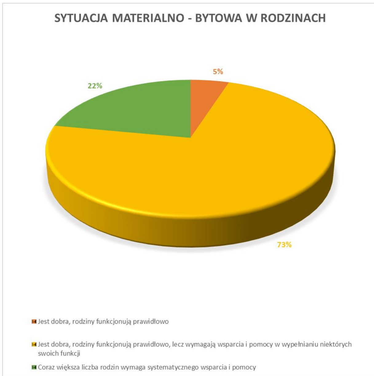
Wykres 1 Sytuacja materialno – bytowa rodzin z terenu gminy Myślenice